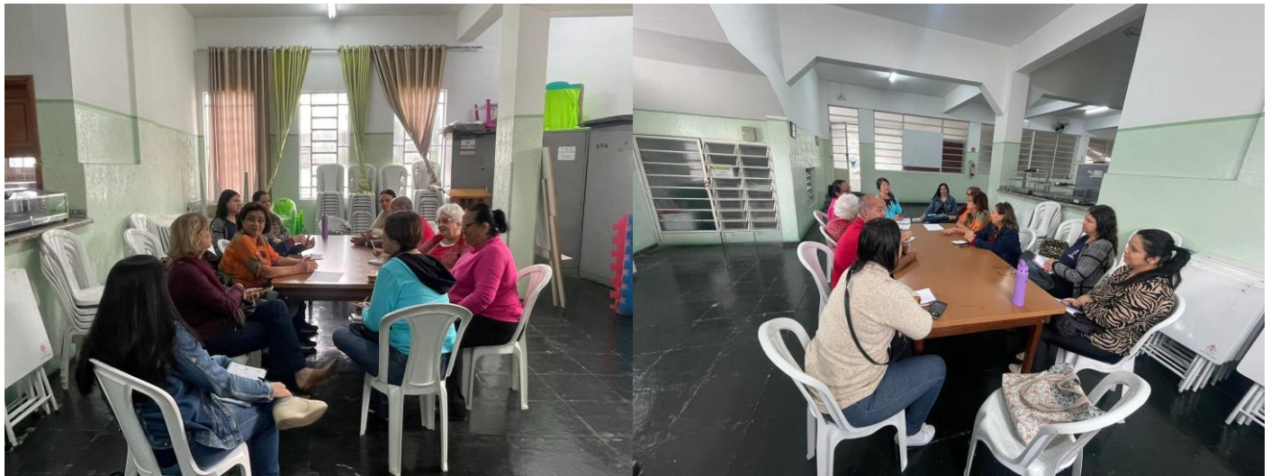
Reunião do Conselho 05/06/2024